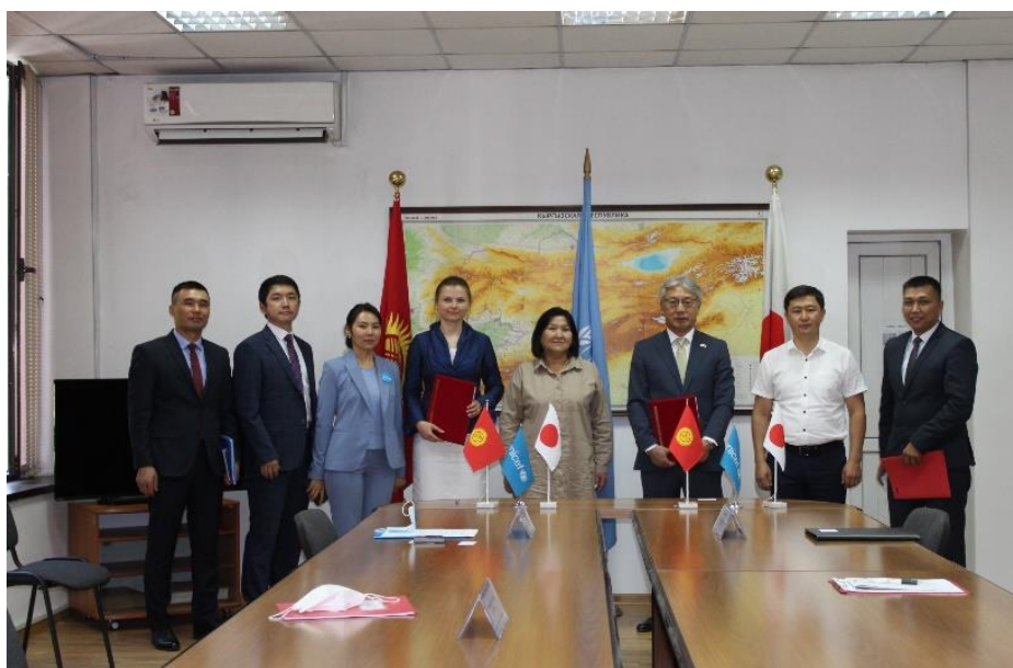
Общая фотография с участниками церемонии